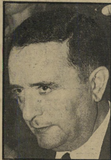
מיועך הראשות עיר סבדור רשלנות, וזוטר והירות וסתם מזל רע

לשוב אל אשליות העבר. גפרור לחבת אבן שריפה. ברגע הראשון, עורר הכרוז תמיהה: לשם מה היה על רשימת כן להפיץ כרוזי תעמולה בין ערביי השטחים? הלא ברור שאפילו שייב עצמו לא האמין כי ייצא ערבי יחיד שיצביע בשבילו. מה עוד, שמרבית הכרוזים חולקו בערי הגדה ובמזרח ירושלים, שם אין לערבים זכות הצבעה כלל. אולם במבט שני, הסתבר שהיתה שיטה בשיעורן הזה. לא היה כל ספק שכרוז