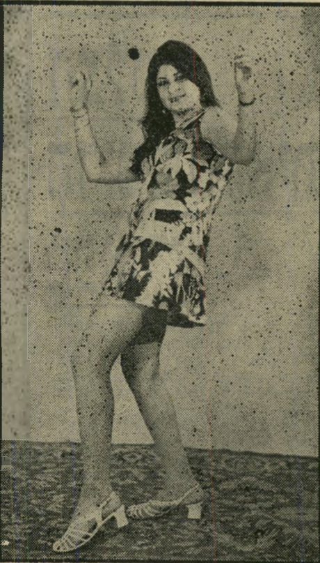
רקדנית עואפף רוב-סיוח

לאחר הופעת המודעות נבחר ביהושע רבינוביץ לראשות העיריית תל-אביב, החתר