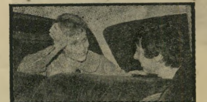
מאריה פארו ואנדרה פרבין

התארסו • מי שהיתה אשתו של הזמר-שחקן פרנק סינטרה, מאריה פארי , רן, והמלחין אנדרה פרבין , הזוג מב-