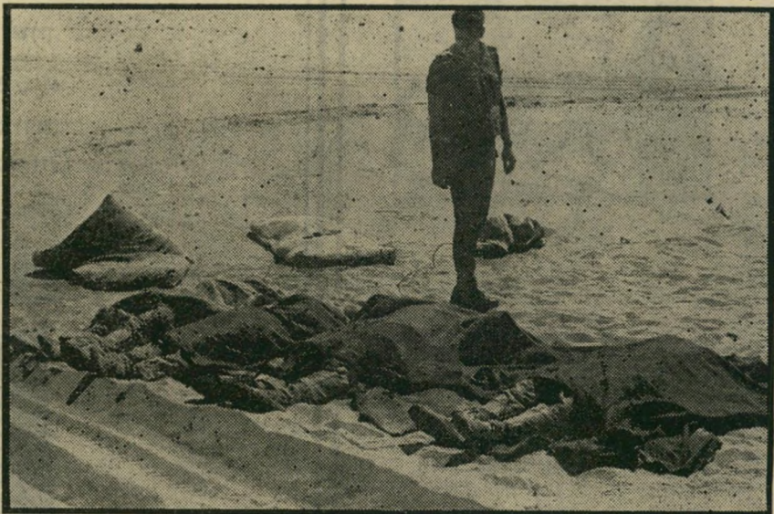
ההרוגים ארבע גהיות מתוך חמש הגהיות של החיילים המצריים שנמצאו ליד המעוז אחרי שהתקפתם נהדפה. הפעם לא היו הפושטים לבושים בבגדים המנומרים של אנשי קומנדו וכפי שניתן להיווכח מהתמונה נעלו נעלי בד עם סוליות גומי.

קודמיו. הוא נפל לבור שכרה בעצמו. לא רק שחייליו לא הצליחו לבצע את המבצע שהוטל עליהם, אלא שהשאירו בשטח כ-10% מחייליהם עוד בסרם שהספיקו להכנס לקרב בכלל.