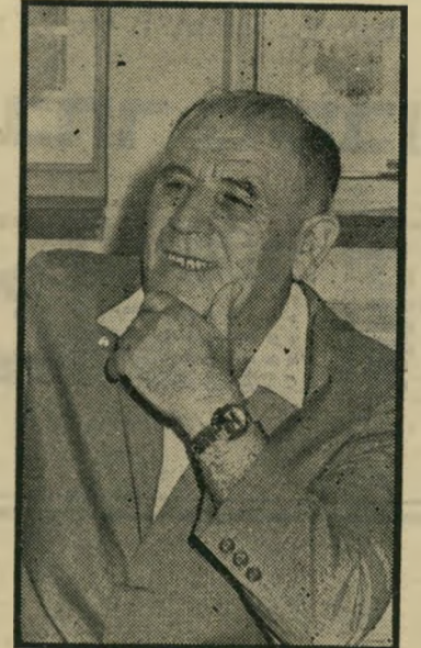
אלמוגי אל חסוב המיקום