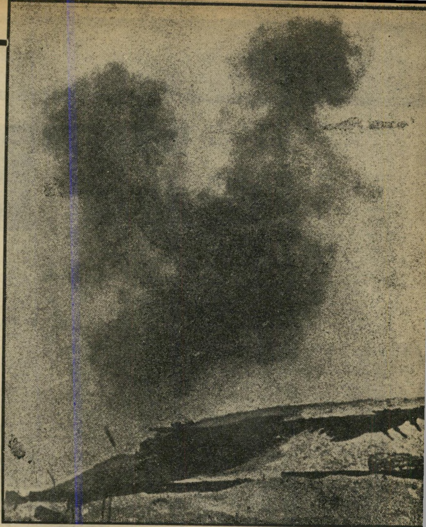
מוצב ותמרות עשן זהו צילום של מעווי צה"ל ליד דורסואר כפי שפורסם בעיתונות המצרית. למצרים יש חשבון ארוך עם מעווי זה, שכן לסענתם הרמטכ"ל שלהם, ריאר, נהרג מאש שנורתה ממוצב זה.

על מעווי זה הונחתה אש מרוכזת במיון חד. במשך 30 דקות כיוונו אליו המצרים מאות רבות של פגזים מתותחיהם הכבדים ביותר. אותה שעה, במרחק של כמה מאות מטרים מצפון למוצב, חצו כ-80 חיילי קומנדו מצריים את התעלה בסירות גומי.