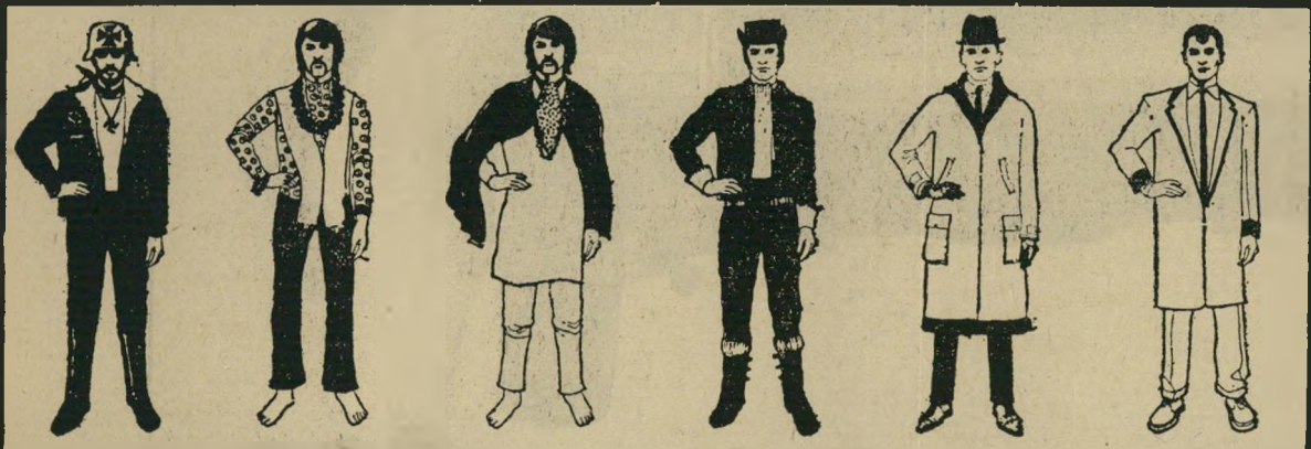
מדי רכיבי מוד רוק ביטניק היפי מולדאך הגריהיום

מה האדירה ביותר בעולם, עת נתפסה כ' שבי צפון-קוריא, הגיעה השבוע ספינת-הריגול האלקטרונית פואבלו לסוף דרכה. דובר הפנטאגון הודיע כי אנית-הריגול ו' שתי אחיותיה, באנאר ופאלס-ביץ', עומדות להיות מוצאות מהשירות, בגלל אי-כדאיותן הכלכלית.