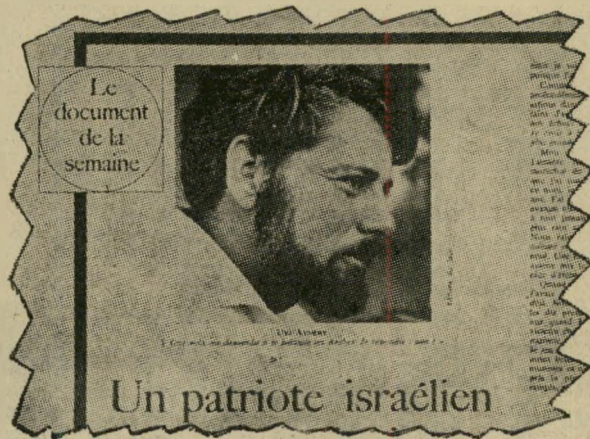
הכותרת ב"נובל אובסטרטר"

והנה בא שבועון זה דווקא ומתחיל לפרסם סידרה של סרקים