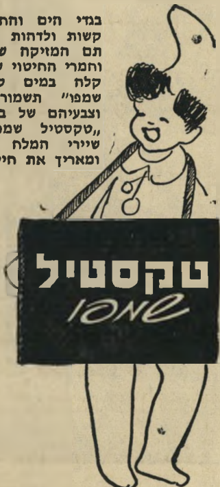
אוצרם ביחיד נקה בעים חספיים חבי נורים בעים

בגדי היס והחוף נוטים להת- קשות ולדחות כתוצאה מהשפע- תם המזיקה של מים, שמש, וחמרי החיטוי שבבריכות. כביסה קלה במים קרים ו„טקסטיל שמפו” תשמור על גמישותם וצבעיהם של בגדי היס והחוף. „טקסטיל שמפו” מוציא את שיירי המלח וחמרי החיטוי, ומאריך את חיי בגד היס.