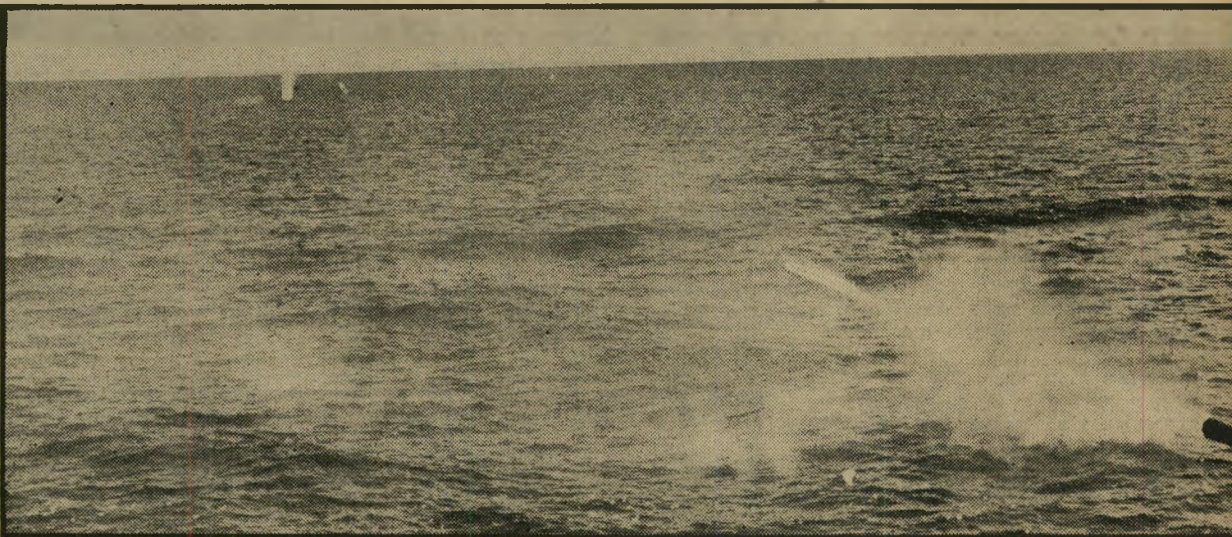
בתמונה נראה אחד התותחים של כלי השיט כשהוא יורה לעבר מטרה במים. ניתן לראות את הפגז היוצא מלוע התותח וכן פגיעה ישירה ליד המטרה במים. הצילום נעשה בשעת אימוני ירי.