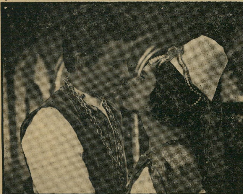
4. סרוונטס (צרפת)