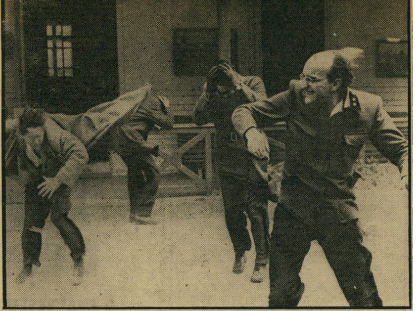
3. רכבות נשמרות היטב (צ'כיה)