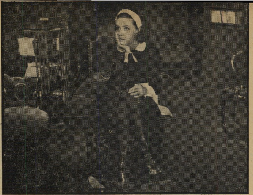
1. יומנה של חדרנית (צרפת)