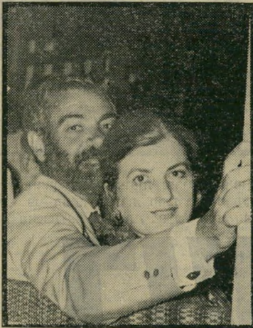
הזוג ידן: אורחים בחיי הלילה

לפני כשנה נפתח בתרועה גדולה הקינ גט קלאב. הושקעו בו כרבע מיליון לירות, ומה שיותר חשוב: טוב טעם. התוצאה היתה מקום מקסים, מרוהט ומקושט בכל מיני אביזרי אבירים, המזכירים את האווירה בסרט אייבנהו.