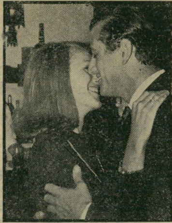
חזני ורני: חברים למקצוע

שתיהן לא היו נשואות אף פעם, אבל למוניקה יש חבר. הם אמנם מתראים פעם בשלושה חודשים, כשמוניקה מגיעה ללוס אנג'לס, אבל מילא, זה יותר טוב מכלום. מי החבר שלה? רופא צעיר - יהודי.