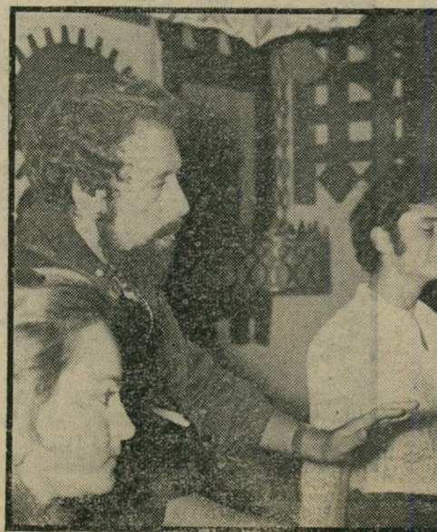
נצ'יק וידידה - קליינטים ותיקים

סילביה תתחיל בקרוב לעבוד כמלצרית במועדון, ונדמה לנו שהגינני שלה יצטרף לפחות עוד שני עוזרים לשמור עליה.