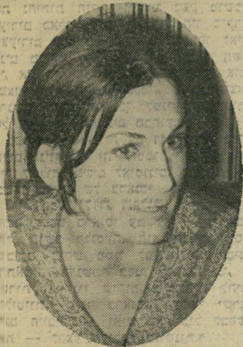
קלוד: חכמה, חתיכה וכו'