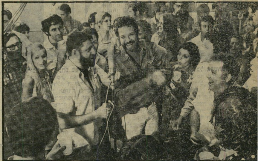
אמני ישראל: מי בעצם רוצה שלום?

אנשי חברת הגר הרגישו כבר מזמן צורך נפשי עמוק לעשות משהו למען השלום, אבל לא ידעו מה. חשבו והשבו, עד שבמצאו מה לעשות והזמינו את כל אמני ישראל להקליט בי עברית את הביארה של ג'ון וויקו: תנו שאנס לשלום. כי כידוע, האומנים הם נושאי איו של למיד השלום בימינו של אריסטו פאנס. מי הא היה שמש יפה ירקוני ויהורם גאון, השאר היו. כדי להיכנס לאווירה של שלום ואחוה שחו כולם ויקקי, ואורי זוהר אמר: גם בקאנאה הקליטו אמנים את תנו שאנס לשלום. יוסי בואי אמר: כן, אבל שם קיבלו כסף. אורי זוהר אמר: יש לנו סיבות טובות מאד לשיר כאלה שירים בחינם, כן וכו'. בומבה ציר שאל: מי בעצם רוצה שלום? וכולם צעקו: אני!!! אני!!! ודרשו לערוך הצבעה. אבל הענין התבטל משום מה, והי