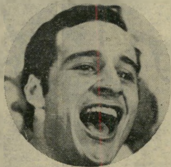
לתת שאנס לשלום: טולידאנו