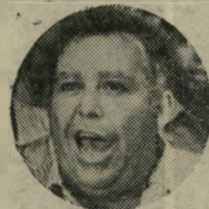
בומבה: מי רוצה?