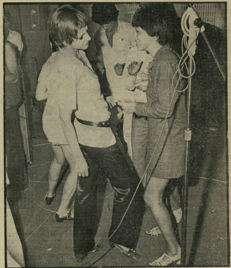
אלונה: מי שלא צחק, שר או רקד או שניהם

מאחורי הזכוכית נראו פניהם העליונות של הטכנאים, שלא איכפת היה להם להישאר עד הבוקר ולחנות ביציאת החינם. הי מסיבה נגמרה בשעות הקטנות של הלילה, ואנחנו מחכים בקוצר רוח לתשובה המצרית.