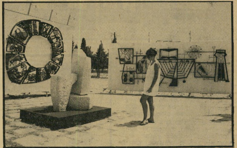
פסטיבל הציון בני התערוכה

★ ערב פיומוני אתרמן (בהפ קת פשנל) פומונים לא כליכך חושים ר חסרי אקטואליות ברובם, המאפיינים בדרך