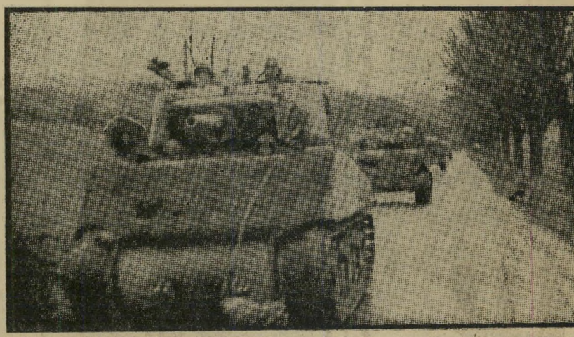
כך נקראו הטנקים האמריקאים בפי הגרמנים, שהשתמשו בהם לפרוץ את הדרך אל "הבלי- טה" הבלגית בשנת 1944. היתה זו אחת ממתקפות הנגד האחרונות של הגרמנים.

סקורצני אסף למטרה זו יחידה מובחרת של חיילים, כולם דוברי אנגלית רהוטה, אותם הכביש במדים בריטיים ואמריקאיים.