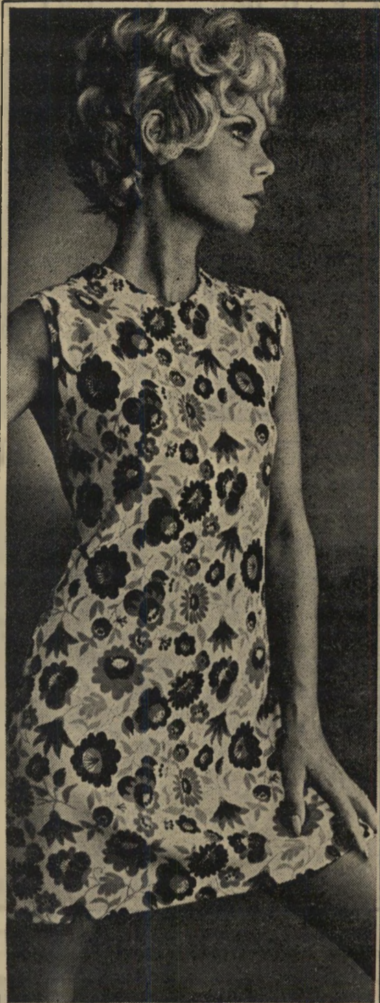
מיוצר ע"י ספעלי. הברלון