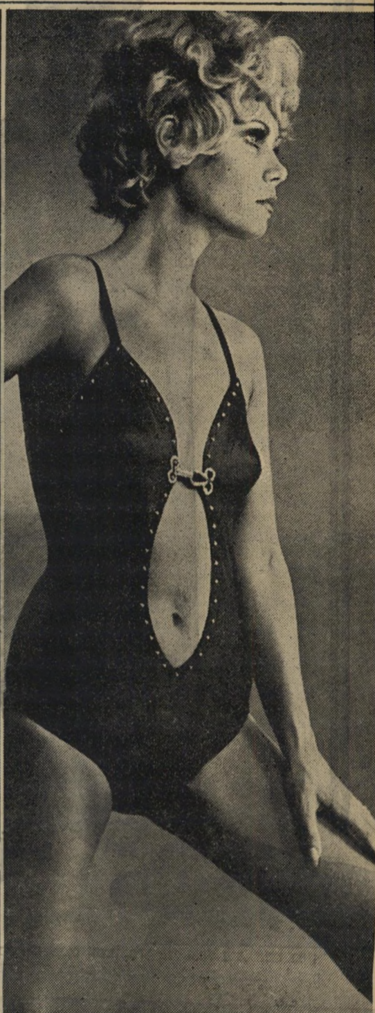
מיוצר ע"י. נומקס

נפלאים, אופנתיים, נעימים לגוף, קלים לכביסה וללא גיהוץ - אלו הם בגדי האופנה עשויים חוטי הלנקה תכונותיהם הנפלאות הן אשר עשו את חוטי הלנקה ל"רבי-מכר". נשים אופנתיות, נשים המעריכות בגד נעים ומחמיא לגופן - מקפידות לקנות בגדים עשויים חוטי הלנקה