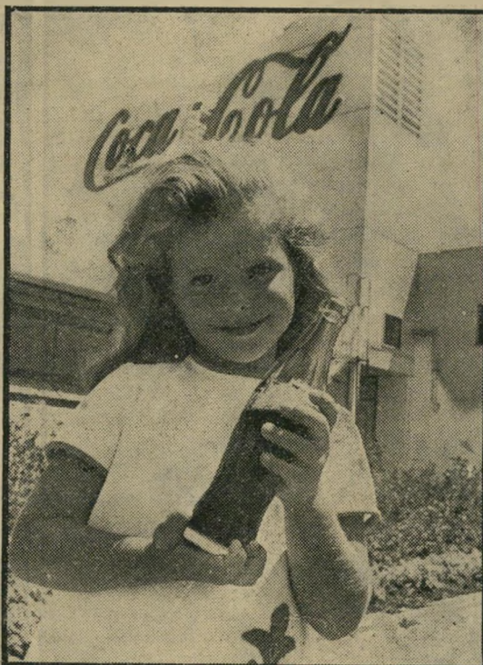
הנסיכה מול הבניין החדוש, מוקף הגנים, בו מיוצר המשקה