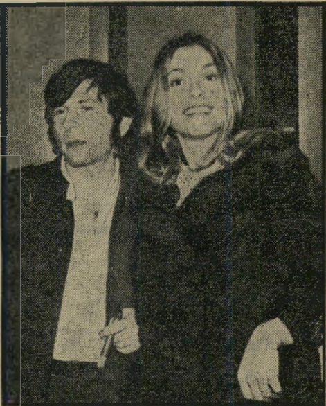
פולנסקי ושרון כמו חיה בג'ונגל

גורלו של הבמאי רומן פולנסקי הוא אכזרי לא רק בגלל הרצח האכזרי של אשתו, אלא משום שהוא עזב עולם אחד, כדי להגיע אל העולם החופשי, ועכשיו הוא החלים לעזוב את העולם החופשי הזה, ולאיוזה עולם הוא יילך? בראיון שנתן לעיתונאי, לאחר הרצח נורא של אשתו שרון טייט, ולאחר ש' הודיע על החלטתו לעזוב את הוליווד, הוא מנתח חריפות את החברה האמריקאית. ראשים ערופים. באמריקה, הוא אומר, אתה יכול להראות בטלוויזיה וב' קולנוע אנשים נהרגים ונשרפים — אבל אתה לא יכול להראות משהו ללא בגדים. זה הרי מסולף, לא? האלימות מחלישה כן במידה מסוימת את כל התשוקות וה' חשקים האמריקאיים, שהשרידים של ה' פוריסניזם לא מאפשרים להם להתבטא. זה הכל עניין של רגלים. יש המון חברות באמריקה הנלחמות למען הלבשת קופים בגני החיות. במשך מאות שנים ניתצו את אברי-המין של הפסלים במויאוי-ניס, או כיסו אותם. רק לפני מאה שנה צדו מכשפות. אסור להראות עירום על המסך. מותר לצעוק ברחוב, בקול רם, כמה שאתה רוצה, את המילה אברי-מין, אבל אם תגיד את המילה המפורשת, אתה בצרות. אף אחד לא חושב שמלחמה זה פחות מוסרי ממין. ולכן כל הערכים של החברה