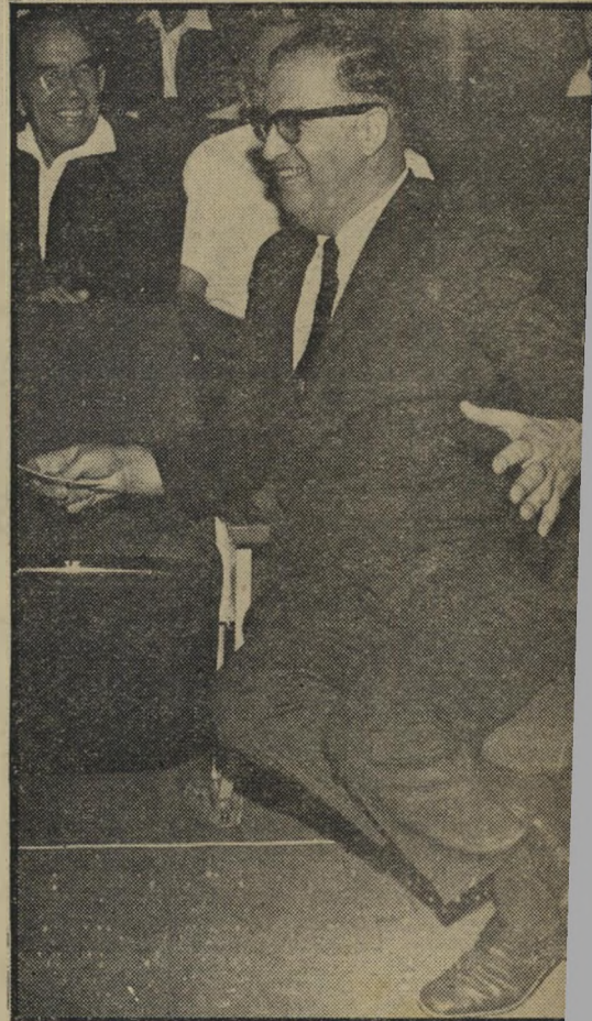
בן גשיתה נלהבת בוועידת המפלגה

ה אנטי-גיבור של השנה היה, ללא ספק, משה ז'יין. בתקופה הראשונה שלאחר מלחמת ששת-הימים האמינו רבים כי דיין, איש המלחמה, יתגלה עתה כאיש-השלום