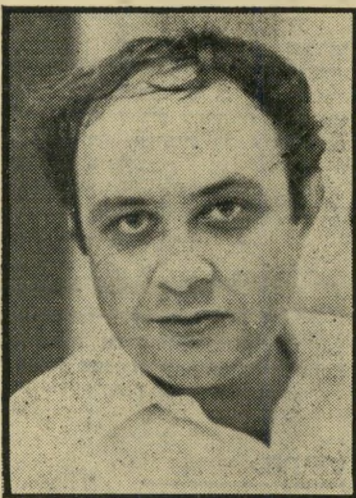
פרקדיוט אדוני המעצור היה שרירותי