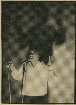
★ אריס סאן ותזמורתו