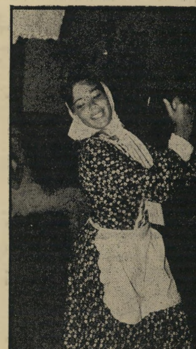
ערנה צינומוזוני רשרר פראג: מקהלה של רבקה

בקיזור, בידור לכל המשפחה. אפשר אפילו להביא את הילדים ולחטוך בייבי