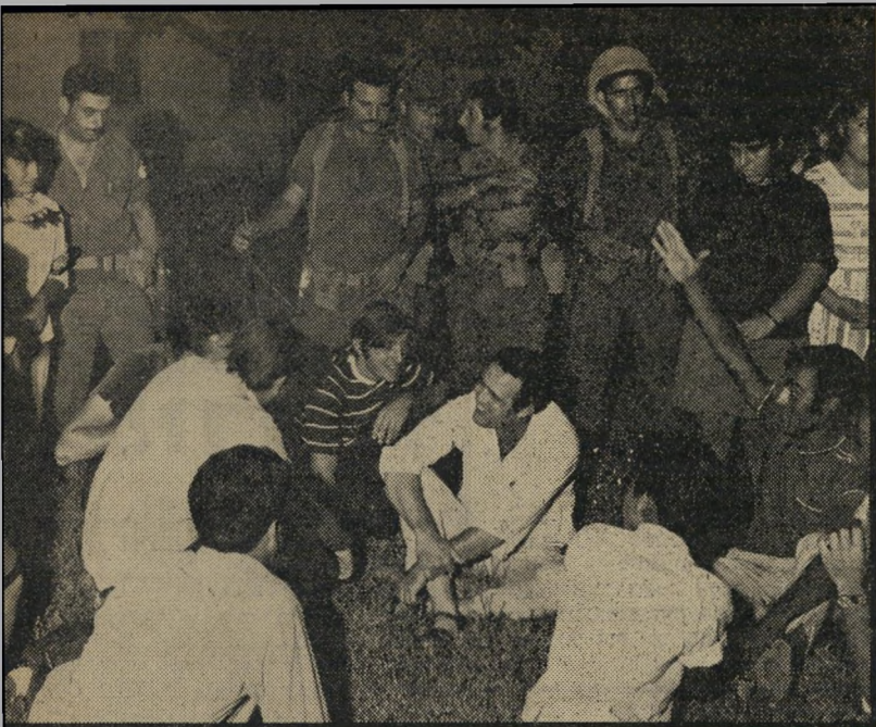
יהורם גאון בירדנה: המ.צ. חיכו על הכביש