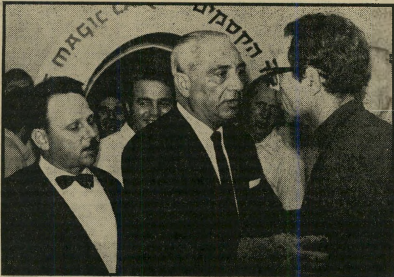
צליק, המנהל ודהאדי: למה לחתיכות מותר?

החיים הקשים של האמנים המתנדבים • האהבה פורחת ב"הארי הסוס" בין ליז וזיילבר • למי מותר להיכנס ל"מרבד הקסמים", למי אסור ולמה