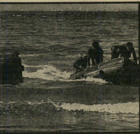
הסירות מתקרבות א

מעט יחידות צבאיות מסוגלות ל- הפעיל את הדמיין ולעורר את הסק- רנות כמו אנשי הקומנדו הימי. יחידות אלה, של לוחמים העשויים ללא-חת, בעלי כשרים ותכונות נדירים, נחשבות בכל ה- עולם כעילית של הלוחמים. העובדה שהם מסוגלים לפעול ולהתקדם מתחת למים היא עובדה מישנית. בראש וראשונה הם אנשי קומנדו, שבנוסף לשאר כישוריהם, קיימת יכולתם כ"אנשי צפרדע". עד למלחמת ששת-הימים היתה יחידת הקומנדו הימי של צה"ל אפופה במעטה של סודיות. קיומה לא הוזכר כימעט כלל. מיבציה לא פורסמו. אנשיה נשארו אל-