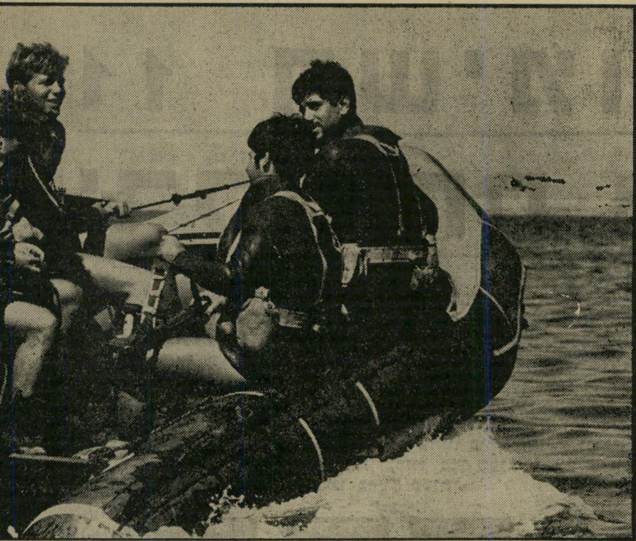
סירת הגומי הממונעת היא כלי הלחימה המהיר של