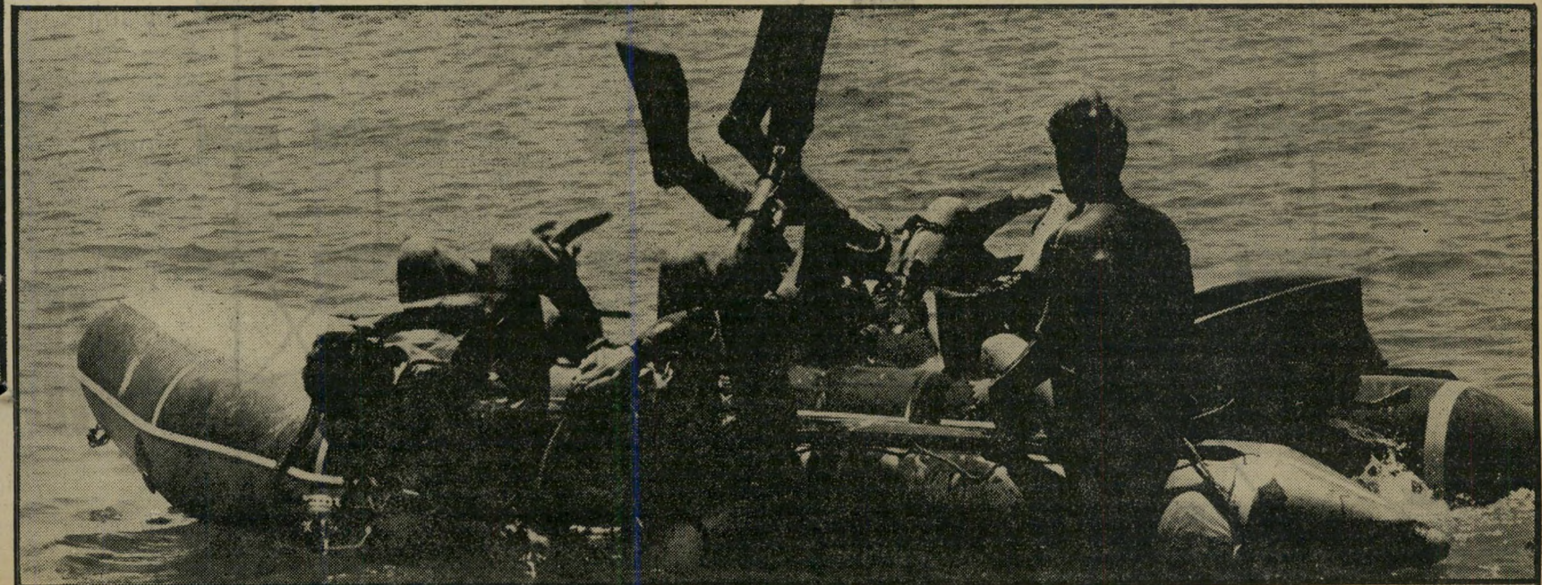
הרגליים עם הסנפירים למעלה, הראש למטה — כד צוללים אנשי חיל-הים מתוך סירות הגומי שלהם