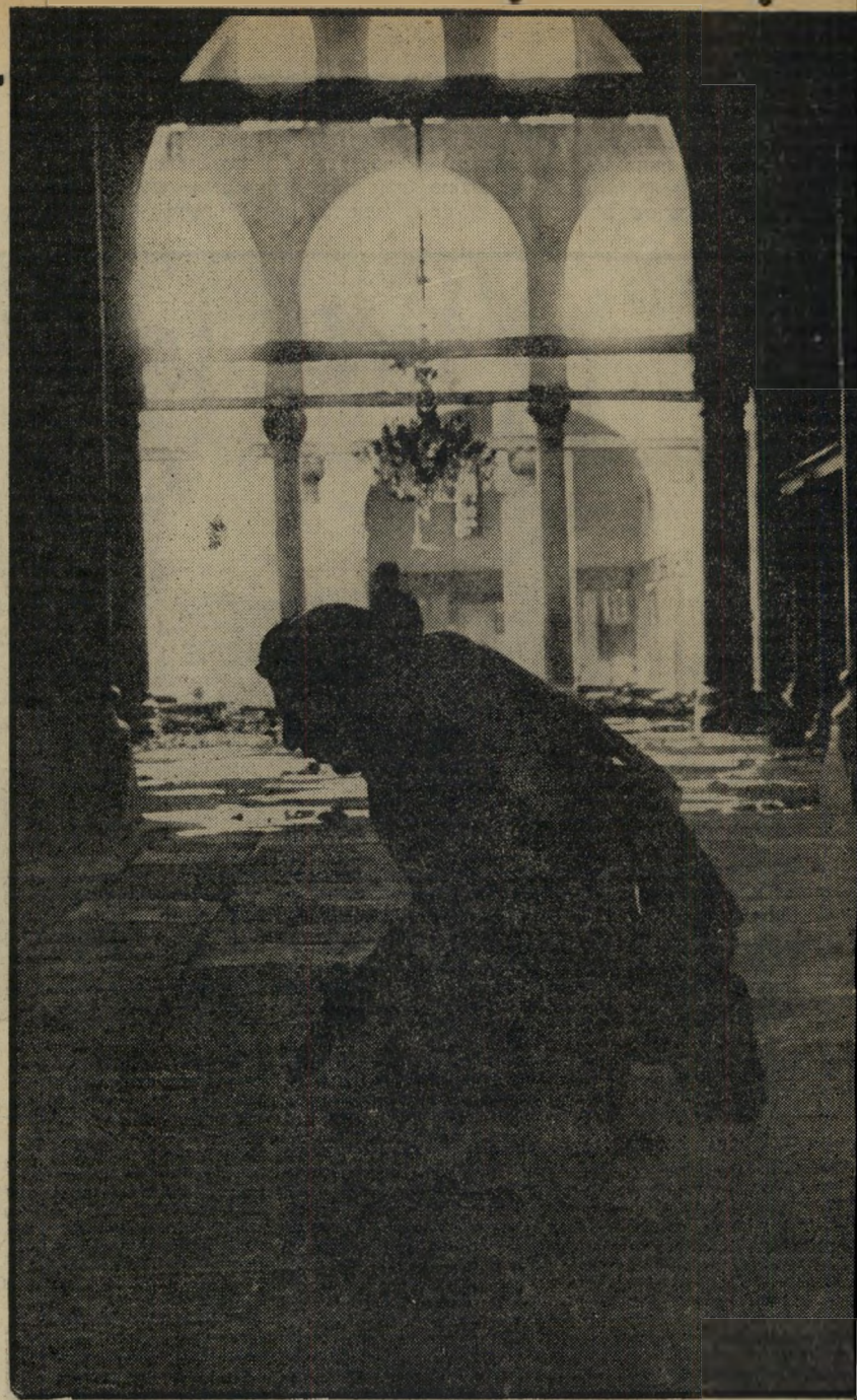
תפילה לאחר החורבן: ערבי נושק את הרצפה המפויחת

העשן העולה מהר הבית וצפירות מכוניות-הכבאים, שימשו כאות אזהרה לתושבים המוסלמיים של העיר העתיקה. הם