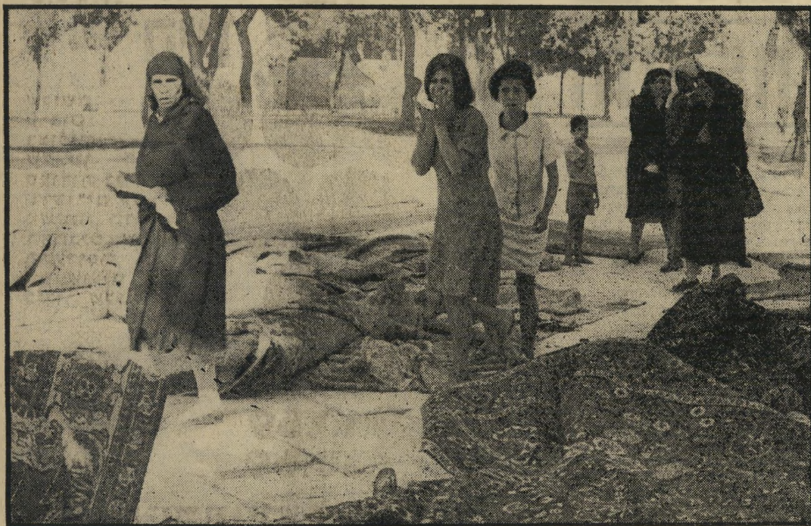
נשים בחצר: השטיחים ניצלו מן השריפה, נשים מקוננות למראה ההרס בתוך המיסגר

ר יפת המיסגר דומה מכמה בחינות לשריפת הרייכסטאג ולא רק מפני שה- מנהיגים הערביים מנסים לנצל את השריפה