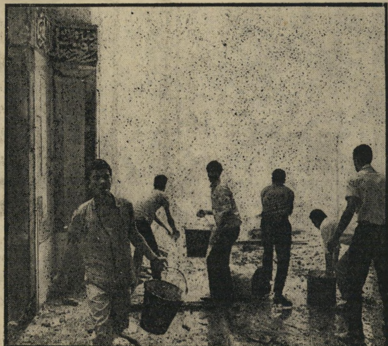
מאמצי ההצלה: צעירים ערביים מכבים בעזרת דליי חוז