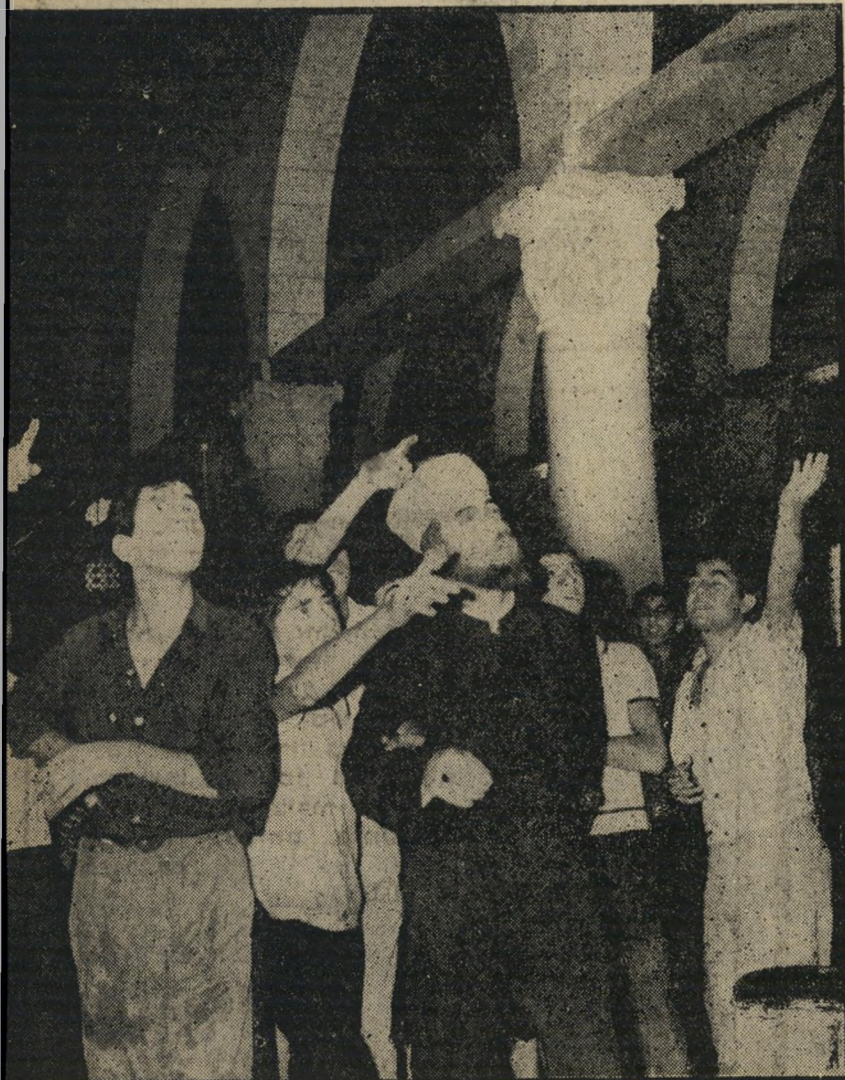
מבט של תמהון: קאדי מתכוונו רגג העורף ושל המיתונד