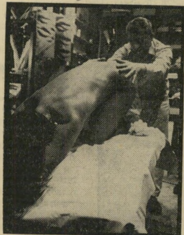
צייר נוימן בפעולה

בהעולם הזה 1659 התפרסמה תמונה שלי בשעת עבודתי, בצירוף סיפור על שהשיתפתו בפאריז ביצירת סרט פורנוגרפי כביכול, שיגיע בקרוב ארצה. אין זה נכון: הצילום מראה אותי כשאני מפסל יצירות בעירום — ובכך אין שום פורנוגרפיה.