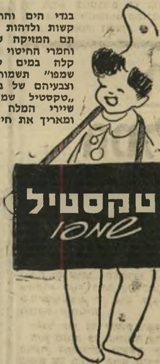
הספיצים חבי נוריים בעינם מוצרים בייחוד נקח בעינם

בגדי הים והחוף נוטים להתיקשקות ולדהות כתוצאה מהשפעתם המזיקה של מים, שמש, וחמרי החיטוי שבבריכות. כביסה קלה במים קרים, טקסטיל שמפוי תשמור על גמישותם וצבעיהם של בגדי הים והחוף. טקסטיל שמפוי מוציא את שירי המלח וחמרי החיטוי, ומאריך את חיי בגד הים.