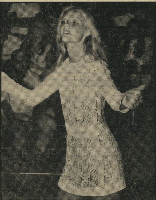
ליז משוודיה: משהו בלי חזיה

דיליים על בלונדית שודית משגעת שקורי אים לה ליו.