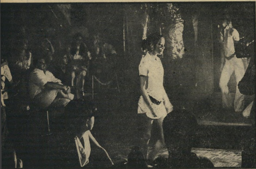
התצוגה ב"הארי הסוס": משהו ערבי בקו צרפתי