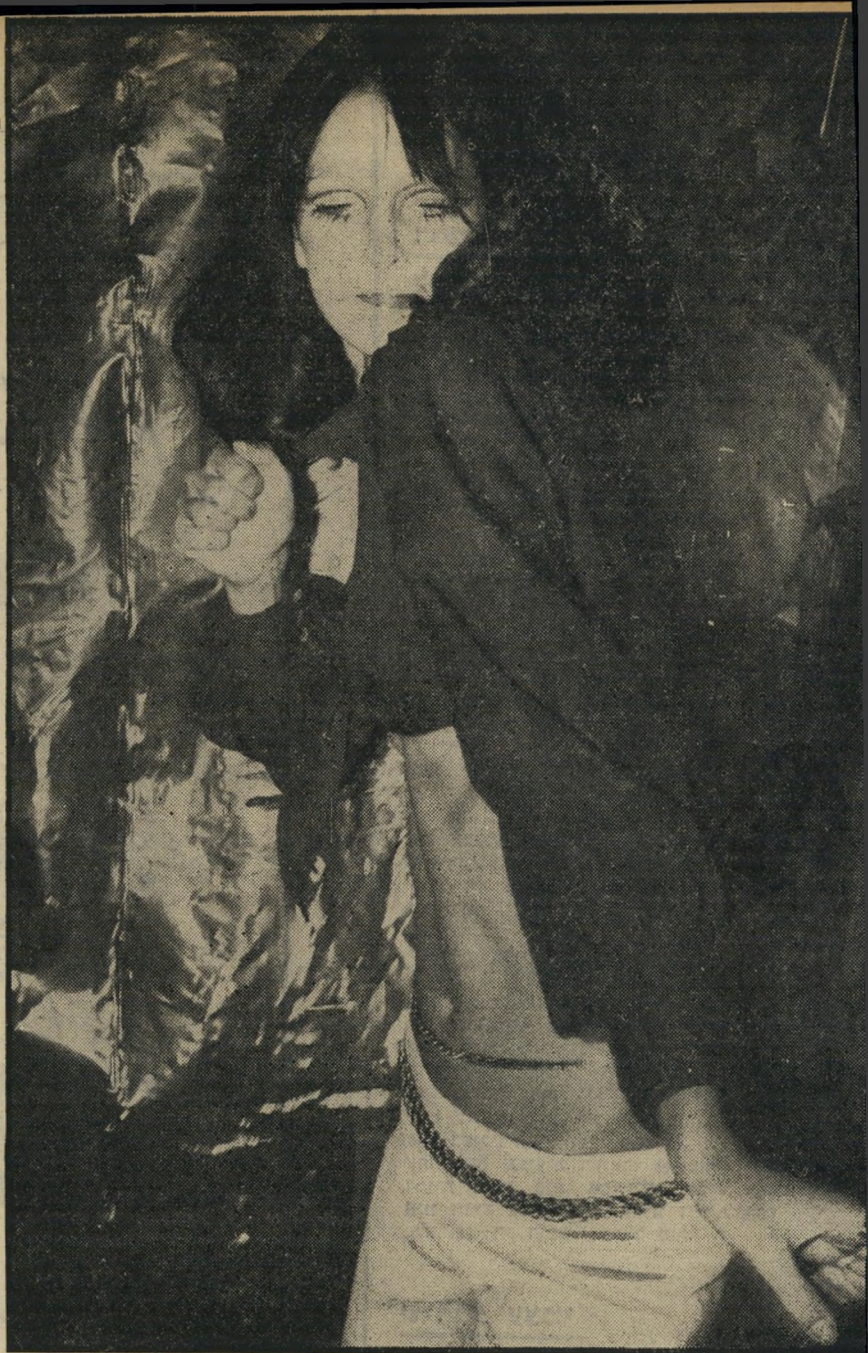
ג'קי מאמריקה: משהו לא נורמלי