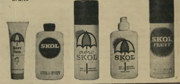
מיוצר בישראל על-ידי בלמון בע"מ • המפיצים: חברת נורית בע"מ

Baby Skol מיוחד לתינוקות ופעוטות באריות שפופרת. Skol Peaux Sensibles קרם מיוחד לעור רגיש Aeroskol ללא שומן במיכל ספריי. לעור רגיל או שמונני. Skol Richtan „סקול ריצ'טן" ללא שומן. מיוחד לעור רגיל או שמונני. Skol Fluff „סקול פלף" קצף במיכל ספריי. מיוחד לעור יבש.