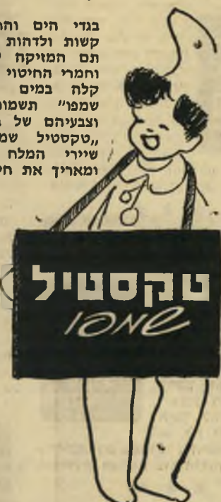
הספיצים חבי נוריים בעים פוצרם ביחיד נקה בעים

בגדי הים והחוף נוטים להתקשות ולדהות כתוצאה מהשפעת תס המזיקה של מים, שמש, וחמרי החיטוי שבבריכות. כביסה קלה במים קרים ו, טקסטיל שמפו" תשמור על גמישותם וצבעיהם של בגדי הים והחוף. "טקסטיל שמפו" מוציא את שיערי המלח וחמרי החיטוי, ומאריך את חיי בגד הים.