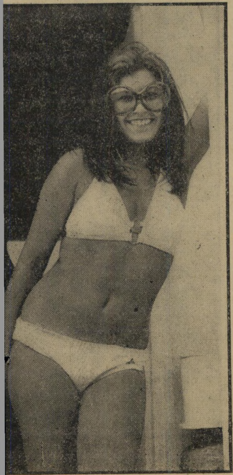
חבר: לט רובנות

מ אז ימי הבארוך ועד לפני שבועיים התנהלו החיים בזיכרון בשקט ובשלחה. כל זיכרונאי נהג להיחלד בזיכרון, ולהתייחס חתן עם זיכרונאית כדי להביא לעולם זיכרונאים קטנים, וחוזר חלילה. בימים היה מעבד את אדמתו, ובערבים היה משחק רמי כמו כל ישראלי הגוה, או שהיה... לא חשוב. וכו' וכו' וכו' עד שהגיעה לזיכרון הרבולוציה בצורת מין מוסד הקרוי בלע"ז דיסקוטק. הדיסקוטק הזה נקרא קאפרי, מגני נים בו טוויסט, רוקדים פאסו דובלה, והוא משמש מקור גאווה לכל המושבה. עוד לפני שפתחו אותו, באה כל זיכרון לראות ולהתרשם, וגם לתת עצות איפה לבנות את הבאר, או "אולי כדאי לפתוח במקומו סטיקיה". זיכרונאי אחד שנחה עליו המוזה לא התאפק וצייר על הקיר פראסקו בצורת וואמפ שרועה על דרגש בפווה מפתה, ואת החכר רות שלה. בסוף היה הכל מוכן. הדיסקוטק נפתח, וכולם באים לשבת קצת, לראות את הוואמפ וגם לראות אם שמעו בקולם ואיך זה יצא. בעיקר גדולה השימחה בליל שבת. הזיכרונאים נועלים את ביתם, על הדלת משאירים פיתקה "המפתח בעציץ", והולכים לבלות. גם חובבי מוסיקה ובילוי ממקומות רחוק