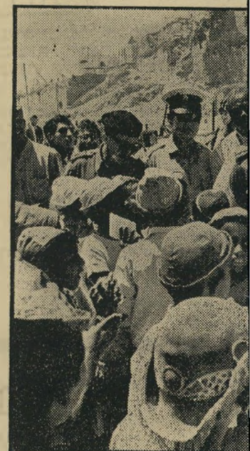
ים: סבלנות של מלאך

אבני הסתכל על המלצר כאילו לא ראה חשבון מימיו ואמר: "מה פיתאום אני מש- לם? אני? אני נראה כמו משהו שמשלם בשביל כחורות?"