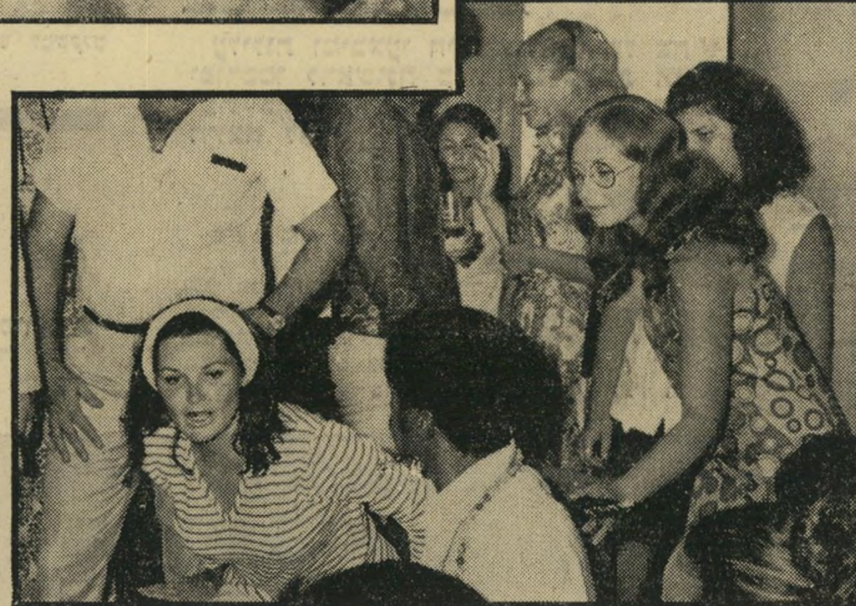
קוקטייל בתל-אביב: חתיכות ומעריצים -

אולם אתם יכולים להתנחם בהבטחה של סמי, אותה הטיח כאשר רואינו על- ידי עיתונאי של "שידורי ישראל": "הא-