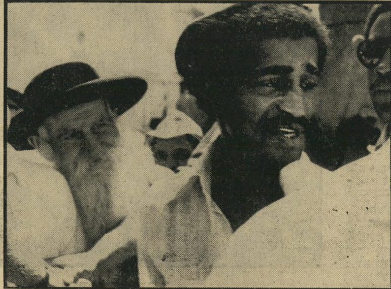
וקצת יידישקייט: עם נטור קרתא -

רץ הזאת זה משהו מיוחד במינו. איזה עם! איזה חיילים! איזה אמביציה! כל לב יהודי ממש גואה למראות האלה. לא כל שכן לב של יהודי-כוש, כמוני. זה היום הגדול ביותר בחיי! וכדי ל- הסיר את החששות שהובעו בפניו על ביקורו הקצר - הוסיף סמי בטון מר- גיע: "אל תדאגו, אבוא לכאן לכמה ימים, כדי לחופיע בפני החיילים!" כאילו שהצהרות כאלו לא היו צפויות ממנו של סמי דיוויס. הבו.