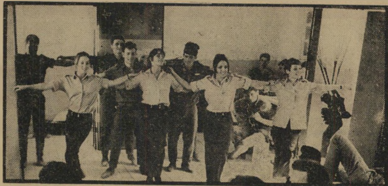
להקת פיקוד מרכז ב"רד אלינו לביקעה"

מאשר בשעה שהוצגו לראשונה, כשמלחמת ששת-הימים היתה יותר טריה. המנגינות של אלכס כגן ובנו מהרי חנינויות, ולמרה הפלא אינן מזכירות לחנים של יוצרים ממור' סדים ומוכרים הרבה יותר. למחבר הנדון לזין מגיעה מדליה, על שהחיה קברט סא-