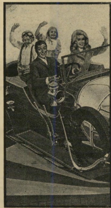
ואןדייק ב"צימי צימי"

*** גברת חסרת-בושה (גור' דוג, תל-אביב). אשה זקנה המסורה למש'