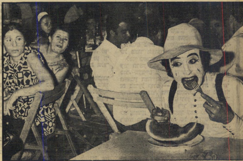
ציוניאל רחוק רמנולת: לא שומעים!

האורחים התל-אביביים הם עם מוזר קצת. כשעוברת ברחוב חתיכה עם מחשוף, הם יוצאים מגדרם. אבל בשביל בידור אמיתי הם אוהבים לשלם, והם לא אוהבים להת- בדר כשהם יושבים בבית-קפה במוצאי שבת,