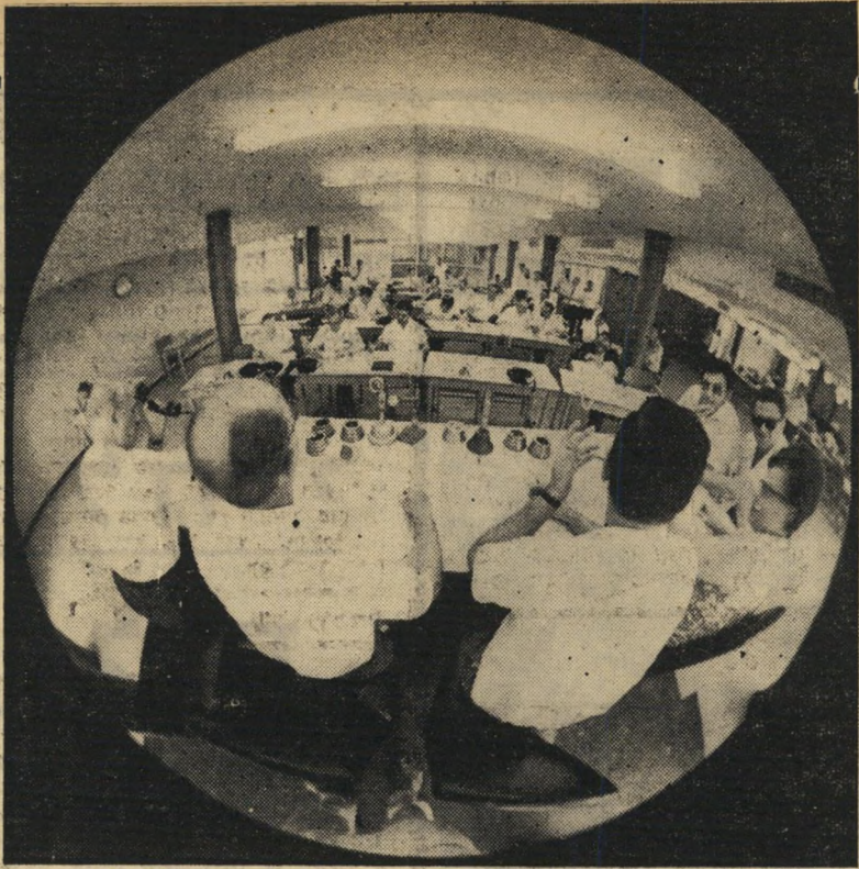
מיקדש המזון: אולם הבורסה בתל-אביב

אולם אותה אועקת-שווא שימשה אור- ארזם לאועקה חמורה הרבה יותר, שזיעזעה את עולם-הכספים הישראלי לא פחות מהת- מוטטיות הבנקים בשנים האחרונות, הנתי- לה מכה חמורה לבורסה התל-אביבית ה-