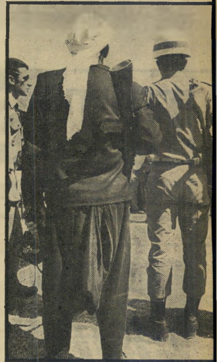
עוזי וקלשניקוב משמרות של צה"ל ושומרים דרוזים איבטחו את החתונה.

קצין גבוה בצבא הסורי, נחשד באי-נאמנות לשלטון לפני 15 שנים, נשלח לגלות בי גזירה שבצפון סוריה, חזר לכפרו רק לפני שבועות מספר. את טקס החתונה בין מנהל הדואר לבין בת-דודו, סיהן בת ה-17, ערכו עוד ביום שישי, בחוג המשפחה. אבל לחגיגה, שפללה גם סעודה כיר השייך, הוזמנו כל בני העדה