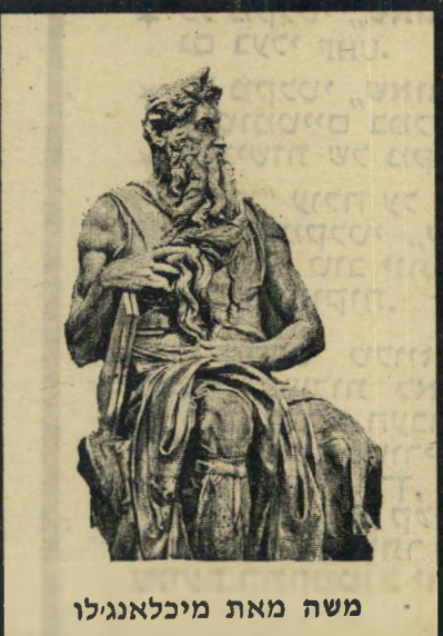
משה מאת מיכלאנג'לו