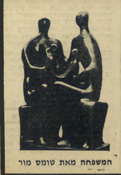
המשפחה מאת טומס מור