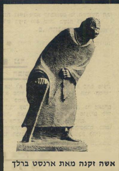
אשה זקנה מאת ארנסט ברלך

קראתי בעיתונים כי ממשלת פולין ציוותה להחרים את ספרו של אורי אבנרי, שהובא לירידי-הספרים בסונזן. לעומת זאת הסתמך פרשן סובייטי חשב-