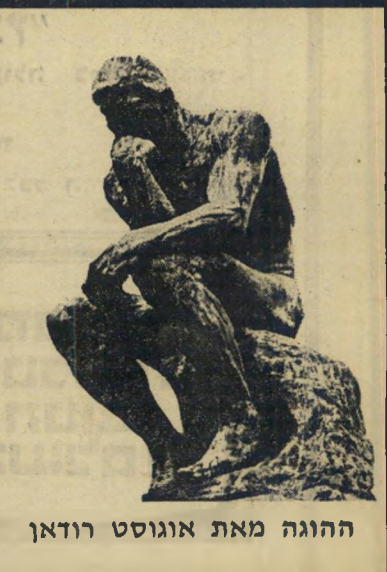
ההוגה מאת אוגוסט רודאן