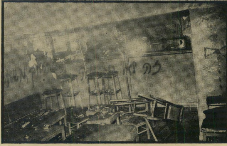
ה"אורדום הצהוב" השרוף: אדם לחווה שפן