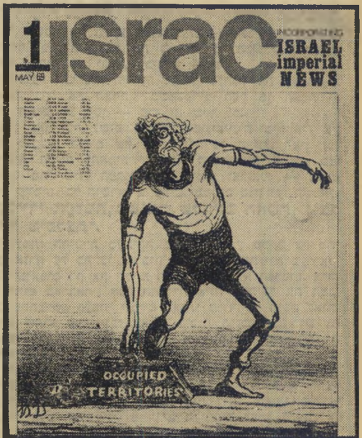
שער החוברת מראה את ישראל מנסה להרים את השטחים המוחזקים