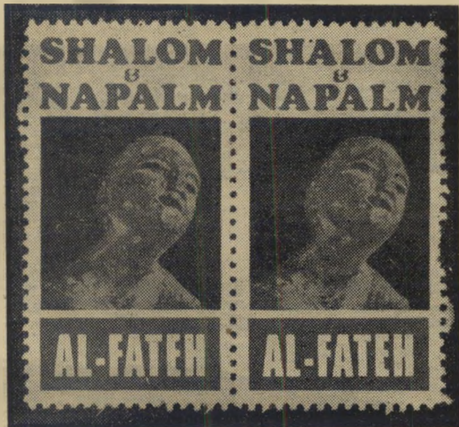
בולים של "אל-פתח" — ילד שנכווה והמילים "שלום ונאפאלם"

פנקים שם כנעריי-השעשועים של השמאל החדש האופנתי, איבדה כל זכות שהיא ליחס של כבוד והערכה מצד הציבור הישראלי.