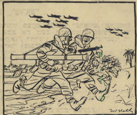
"עלינו לעצור את התוקפנים ההם!" חיילי צה"ל כאמריקאים בוויאט-נאם