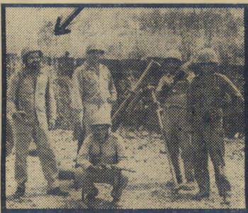
חייל לדני (משמאל) וחברים

תמונת חללי צה"ל, מול משתמטי הישי' בות (העולם הזה 1653) עברה אצלנו במוצב מיד ליד. הפעם קלעתם בול. אולם אין לעשות עוול לכלל הדתיים. אני עצמי רחוק מדת ואמונה, אך יחד איתי