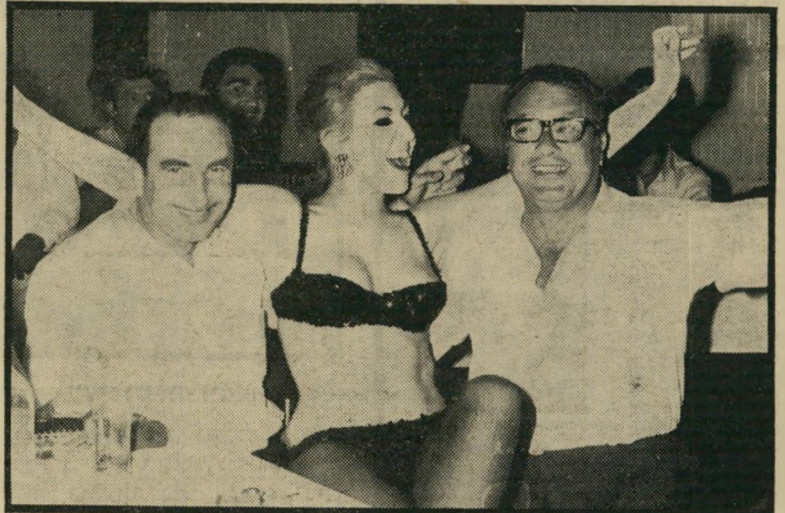
מארו משמחת לבב אנוש

לפני שתשמעו את הסיפור, נסביר לכם רק, שלוונות יש סיודר-עבודה בשיטה דומה