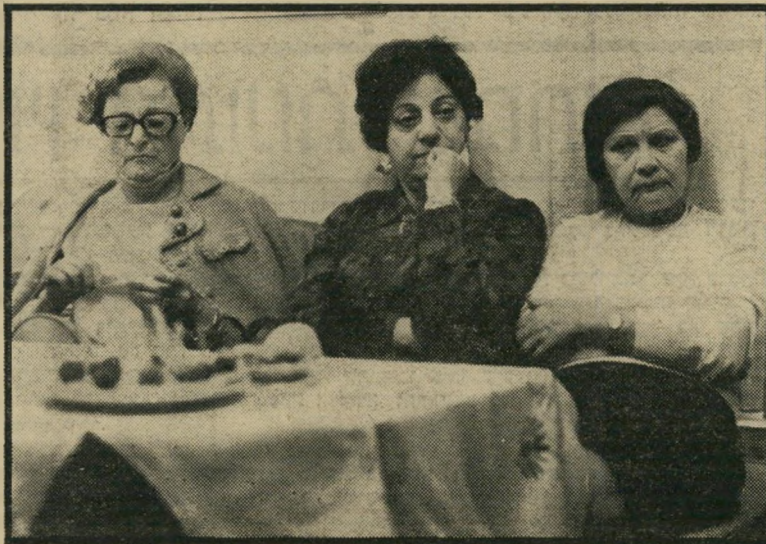
מקשיבות להרצאת הדוקטור

כולם עייפים ומרוצים. אפשר כבר ללכת הביתה. את בעיות העולם גמרו לפתור ובעיות העיר תל-אביב יחכו לשבוע הבא.