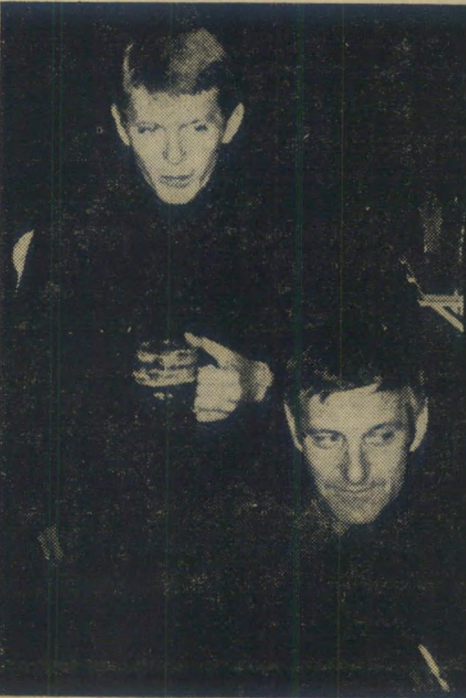
טייטים בפאב "אוויה"

מישהו מהאורחים, אלא הארב אדאמס, דוג"מ מן מיקצועי לאומנת-גברים, שריחף על ה"מסלול באצילות אלגנטית ובטבעיות מעוררת קינאה. הוא נראה כאלו גולד שם, על המסלול, לבוש בחליפה אנגלית וכובע