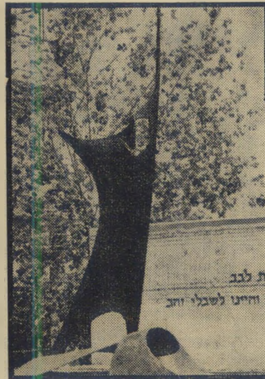
האנדרטה בחדרה והגבולות ישונו. יותר מדי אנשים הלכו למות...