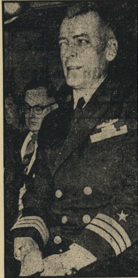
רבי-חובל בוכר איבראהים השני

כל עוד היה צה"ת האונייה כלוא במח-נות-העניינים של קוריאה, לא נדונו נסי-בות הכניעה. אך כאשר שוחרר הצה"ת, לא