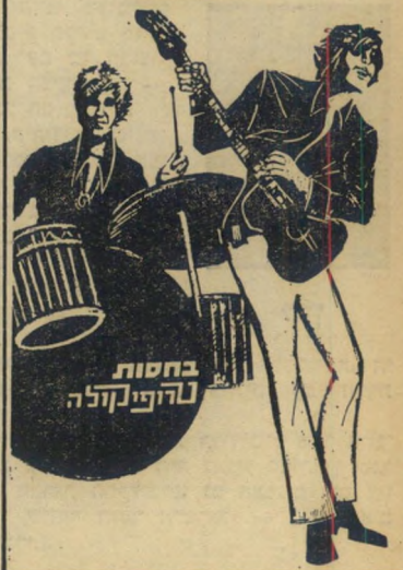
בחסות נהיט קדלה