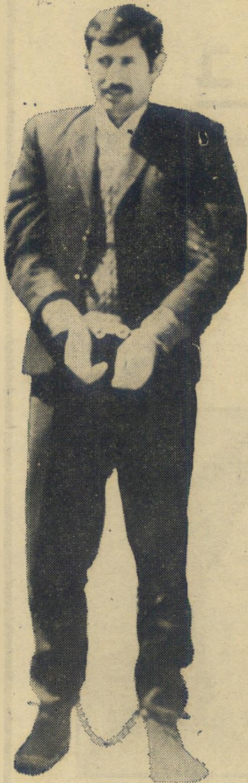
טרוריסט גיאבר "אני מלשין?"

עונה על שאלות בית־המשפט. אני יודע שממילא שלטונות ישראל יודעים הכל."