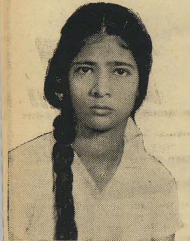
נתקפת אליזבת מוט על הראש

אני מאמינה שיתכן ויש דבר כזה כמו סוחרים-נשים, אבל למה שהם ירצו לסחור דווקא בי? אם הם באמת כאלה, אז הם שחקנים מצויינים. עלי הם לא עשו רושם של סוחרים-נשים. אולי אוקי כן, אבל רופו בהחלט לא. הם לא ניסו אף פעם להתעסק איתי. תמיד הם התנהגו בנימוס. הם התנהגו אלי כגינטלמנים ממש, לא כמו הישראליים שלנו.