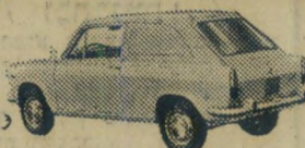
124 פרימולה המסחרית המהודרת

אביזרי הבטיחות של ה"124" כוללים בין השאר מעצורי-דיסק ב-4 הגלגלים. ה"124" בעלת יכולת תמרון בלתי רגילה בתנועה צפופה ומצויינת לנסיעה ממושכת. זאת, ועוד מעלות ויתרונות רבים. אכן, זוהי מכונית בעלת איכות מעולה שאין לה מתחרים — היא האחת והיחידה.