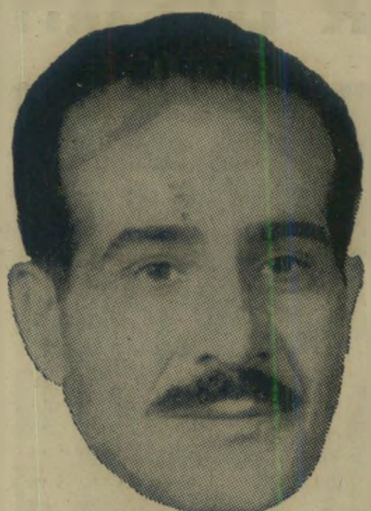
סופר אל"עגיבה חסקנה ברורה

"הפיתרון לבעיות האזור", אומר אל"עגיבה, "אינו פיתרון שיכפה עלינו מבחוץ, אלא הפיתרון שמחייבת המציאות החדשה באזור,