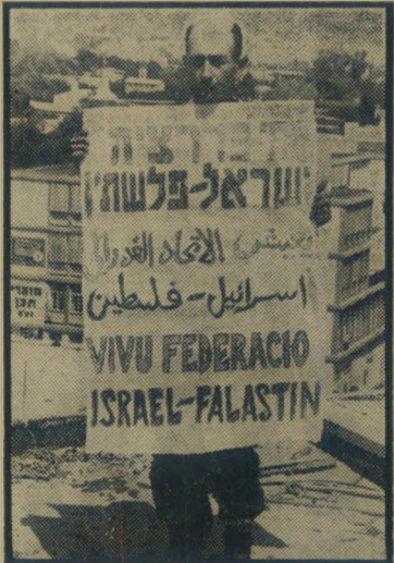
זמיר צועד (מלפנים) — פדרציה ב"ן —

על הכרזה הקדומית רשם את הסיסמה תחי פדרציה ישראל-פלסטיין, בעברית, ערבית